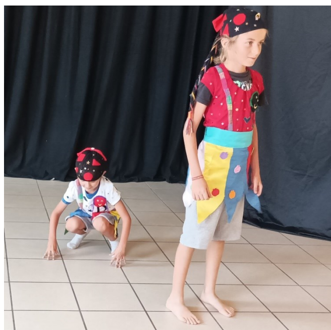
Le jeu de l'acteur