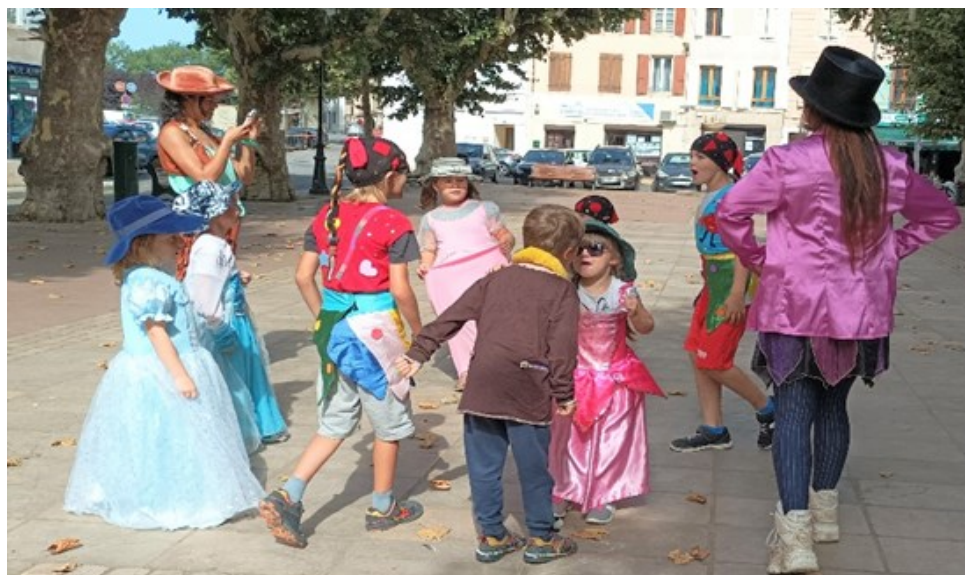
Théâtre de rue